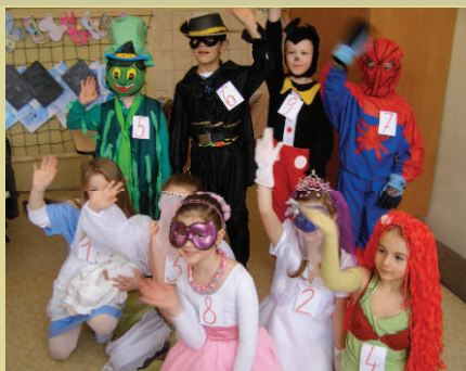
17. február 2012 - fašiangový školský karneval - masky 1. ročníka.