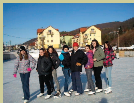
Kl兹isko Sv. Anton - hodina telesnej výchovy 9.ročníka.