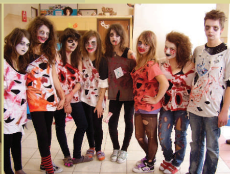
Fašiangový školský karneval 2012 - kolektívna maska Zombíci - 8.ročníka.