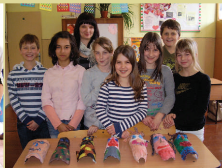
Kaširovanie - netradičná technika vytvárania masiek na hodine výtvarnej výchovy - žiaci 5. ročníka.