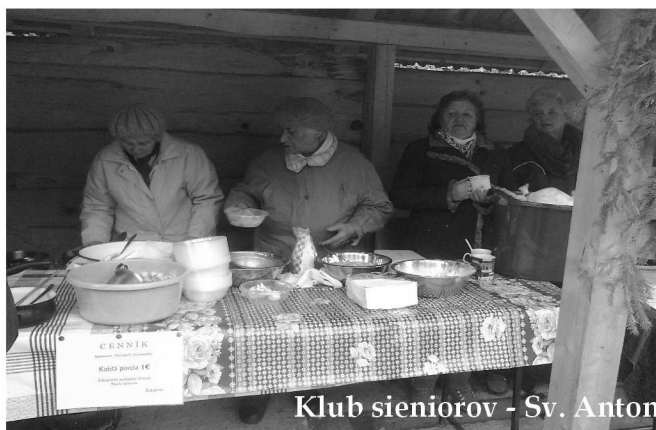
Klub seniorov - Sv. Anton