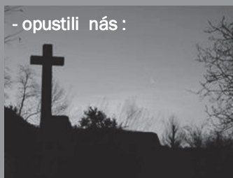
- opustili nás :