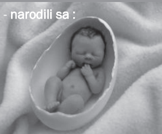
- narodili sa :