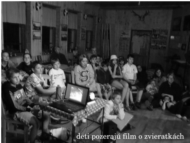
deti pozerajú film o zvieratkách