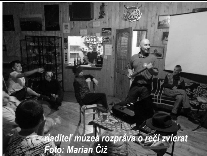
riaditeľ múzea rozpráva o reči zvierat

Náš príspevok začneme slovami ľudovej piesne " Keď ma srdce bolí, keď ma tiešeň morí, zájdem si ja pod večierkom do zelenej hory. Kukulienka kuká, hlas jej sladko rinie a do srdca boľavého potešenie plynie..." Takto sa liečili naši predkovia a slová tejto piesne sú platné aj pre dnešného človeka. Les a príroda sú našou neoddeliteľnou súčasťou. Dňa 21.6. 2019, pri príležitosti Mesiaca poľovníctva a ochrany prírody, sa starostovia obcí Svätý Anton a Ilija, Múzeum Svätý Anton a chata Sitno rozhodli usporiadať pre rodičov a ich ratolesti a zároveň pre všetkých priateľov prírody, výstup na naše bájne Sitno. Organizácia bola výborná. Deň vopred sme si mohli v kaviarni " Na rínku" /ďakujeme dievčatá/, uložiť spacáky a deky, ktoré nám pán starosta vyviezol až na chatu Sitno. V piatok podvečer sme sa všetci stretli na rínku a ďalšou zástavkou bola Ilija, kde sa k nám pridali priatelia z Ilije a vedno spolu sme sa vydali na Sitno. Cesta nám príjemne ubiehal, aj dážď nás na chvíľu prišiel pozdraviť, a po dvoch hodinách sme dorazili na Sitno. Tam už nás čakali chatári, ohník a tak sme vytiahli domáce zásoby a dali sa do hodovania. Večer na Sitne bol nádherný. Krásne výhľady, vôňa pečenej slaniny, zapadajúce slnko, detský smiech, to všetko