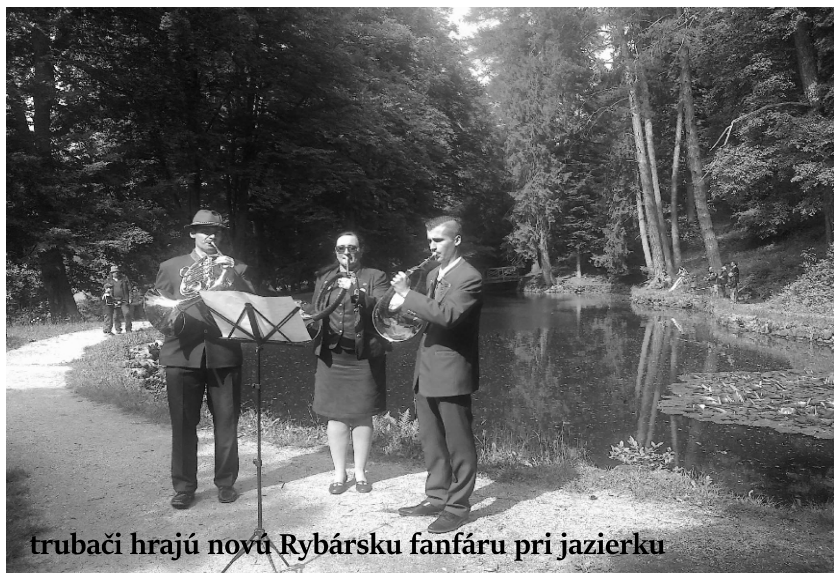
trubači hrajú novú Rybársku fanfáru pri jazierku