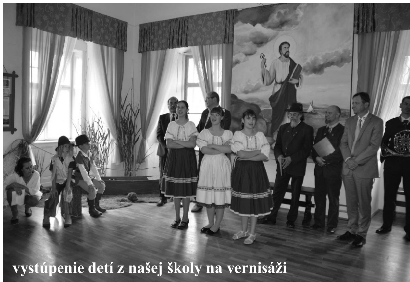
vystúpenie detí z našej školy na vernisáži