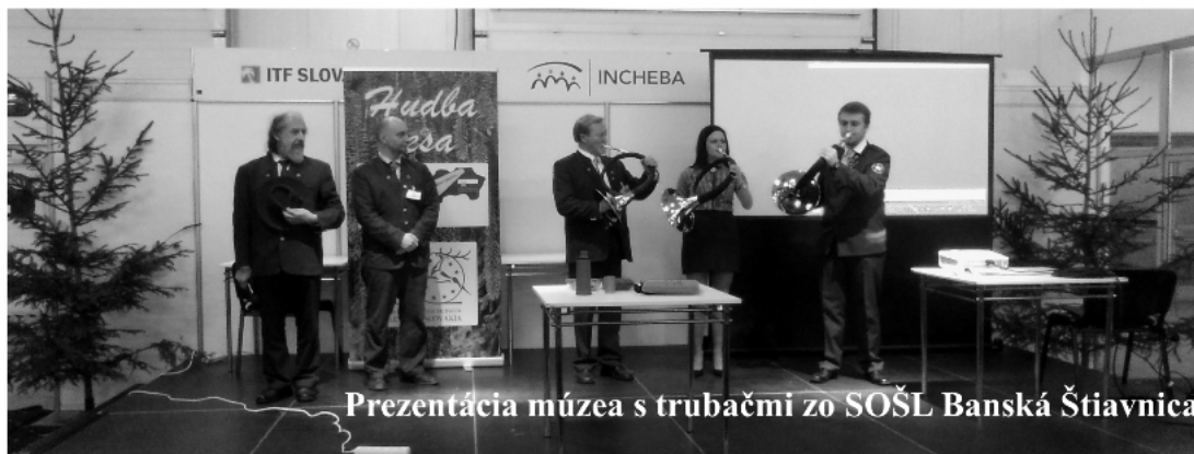
Prezentácia múzea s trubačmi zo SOŠL Banská Štiavnica