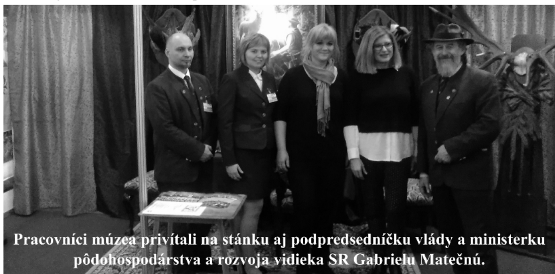
Pracovníci múzea privítali na stánku aj podpredsedníčku vlády a ministerku pôdohospodárstva a rozvoja vidieka SR Gabrielu Matečnú.