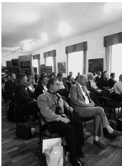
Seminar Koháryovci, foto: M. Lukáč

V rozháraných dobách, v časoch neprestajných tureckých nájzdov a protihabsburských povstaní v 16. storočí sa objavil v Hontianskej župe rod, ktorý vďaka vernosti panovníkovi a hrdinským činom v protitureckých bojoch získal postavenie, slávu a v neposlednom rade aj majetok. „Za Boha, kráľa a vlasť!“ – to bolo heslo rodu KOHÁRY, ktorý bol úzko spojený so svätoantonským kaštieľom.