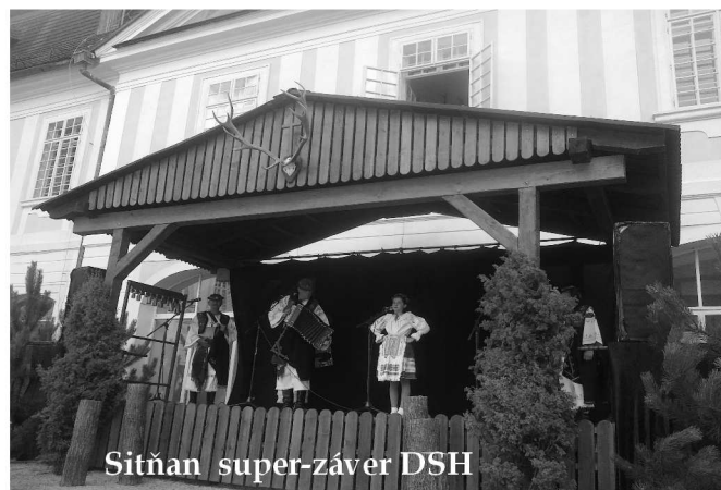
Sitňan super-záver DSH