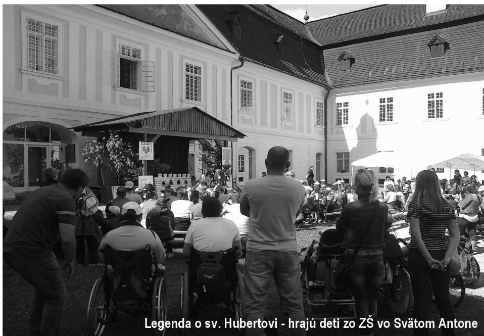
Legenda o sv. Hubertovi - hrajú deti zo ZŠ vo Svätom Antone