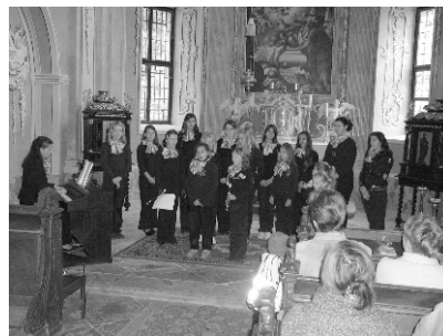
Deti z Materskej školy vo Sv. An-

tone a malí speváci zo Základnej umeleckej školy v Banskej Štiavnici dňa 28.10.2009 spríjemnili slávnostné posedenie našich starších občanov od 60 rokov, ktorých sme pozvali do kaplnky Múzea vo Sv. Antone pri príležitosti Októbra - mesiaca úcty k starším. Piesňami a nežnými slovami básnika v takmer hodinovom programe rozveselili srdiečka tých, ktorí už prežili pár desiatok rokov na tejto zemi. Podujatie "Mladí duchom" bolo obohatené aj vystavkou výtvarných detských prác zo ZUŠ v B. Štiavnici. Občerstvenie, ako aj darčeky pre prítomných pripravil Obecný úrad vo Svätom Antone. Tento projekt bol realizovaný aj vďaka podpore Zväzu múzeí na Slovensku.