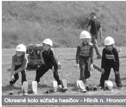
Okresné kolo súťaže hasičov - Hliník n. Hronom