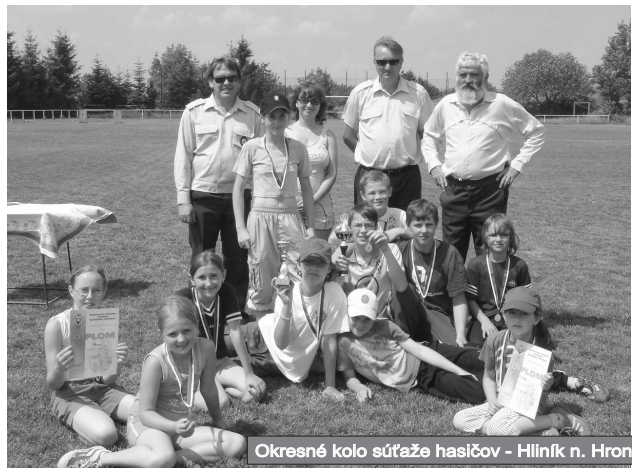
Okresné kolo súťaže hasičov - Hliník n. Hronom