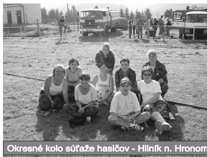
Okresné kolo súťaže hasičov - Hliník n. Hronom